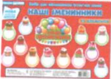
28 13104121У Плакати Додавання