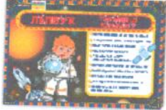
42 13105165У Набір прикрас Символи України