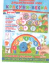
38 13104131У Плакати Паркан думок