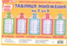
29 13104122У Плакати Множення