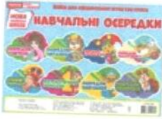
43 15211011У Дидактичні ігри Красуня весна