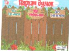
39 13104127У Набір для оформлення інтер'єру Склад числа