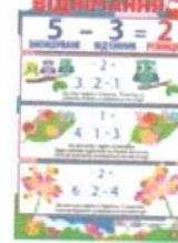
20 11106019У Набір карток Читаємо речення