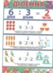
36 13104133У Набір карток Сигнальні картки