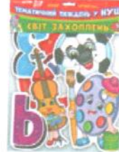
22 13104135У Набір для оформлення інтер'єру Наші іменинники