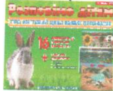
33 13105169У Набір прикрас Світ захоплень