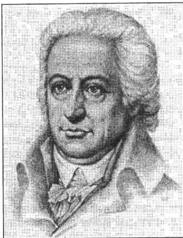
Йоганн Вольфганг Гете 1759-1837

Балада (фр. ballade - танцювати) – жанр ліро-епічної поезії фантастичного, історико-героїчного або соціально-побутового змісту з драматичним сюжетом.